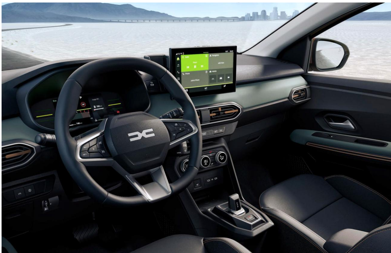
Ψηφιακός πίνακας οργάνων 3,5" & Σύστημα πολυμέσων Media Display 10,1"