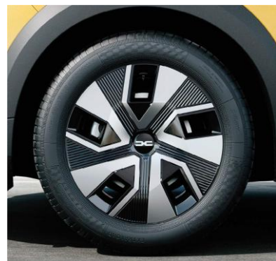
Τροχοί 16" & ελαστικά 205/60 R16