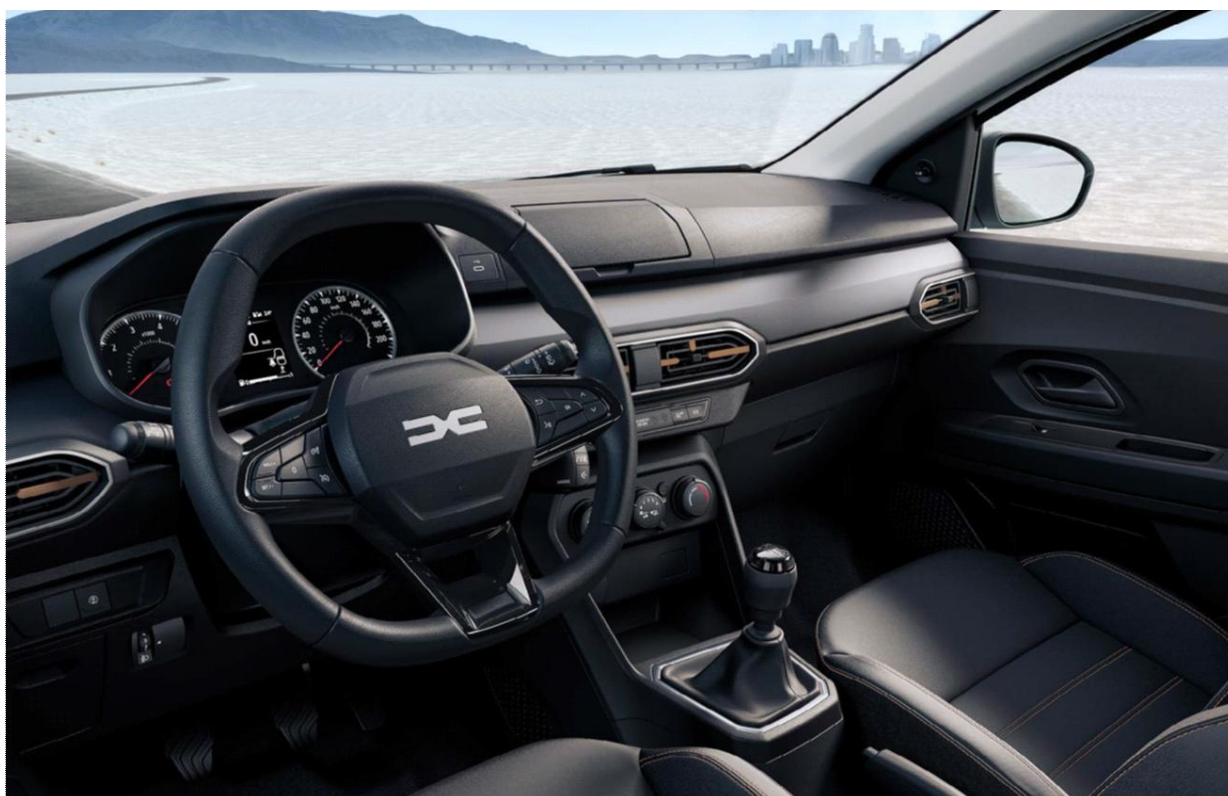
Πίνακας οργάνων με οθόνη 3,5" & Σύστημα πολυμέσων Media Control