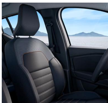
Υφασμάτινες επενδύσεις καθισμάτων