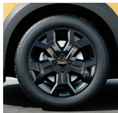
Τροχί 16" & ελαστικά 205/60 R16