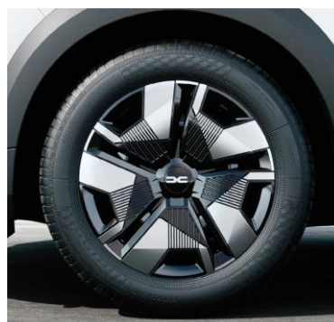
Τροχοί 16" & ελαστικά 205/60 R16