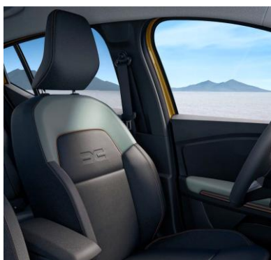
Υφασμάτινες επενδύσεις καθισμάτων