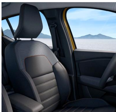
Υφασμάτινες επενδύσεις καθισμάτων