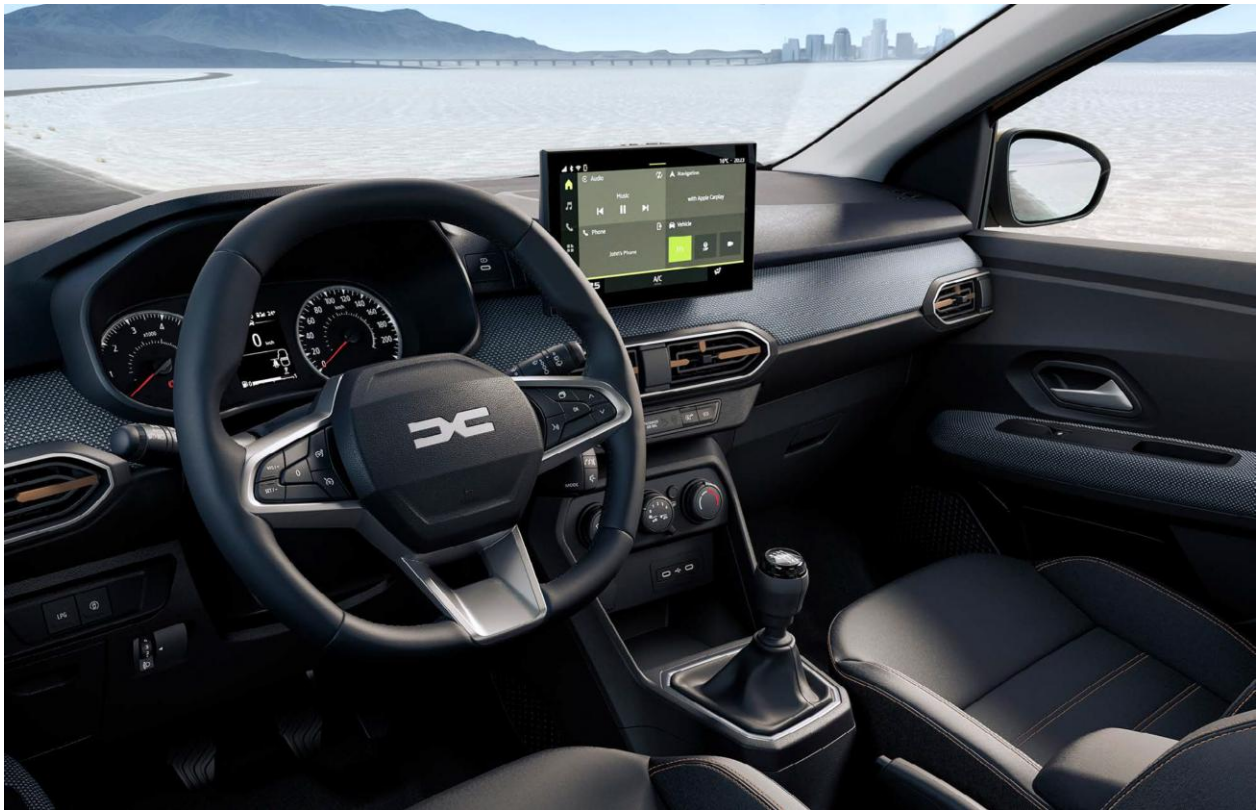
Ψηφιακός πίνακας οργάνων 3,5" & Σύστημα πολυμέσων Media Display 10,1"