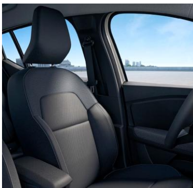
Υφασμάτινες επενδύσεις καθισμάτων