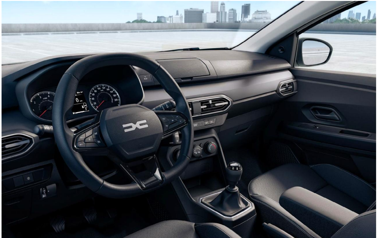
Πίνακα οργάνων με οθόνη 3,5" & Σύστημα πολυμέσων Media Control