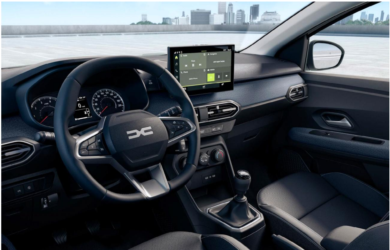
Ψηφιακός πίνακας οργάνων 3,5" & Σύστημα πολυμέσων Media Display 10,1"