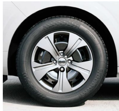
Τροχοί 15" & ελαστικά 185/65 R15