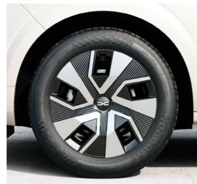
Τροχοί 16" & ελαστικά 195/55 R16